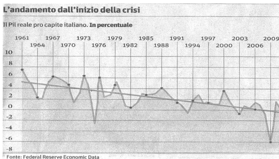
Grafico 1 - Sole 24Ore

Il dato può essere letto in molti modi, ma sembra corretto dire che: una quota crescente della popolazione italiana nel corso del cinquantennio 1960-2010 è progressivamente diventata estranea alla produzione di ricchezza. Il dato è coerente con diverse altre osservazioni (dal 1991 al 2001 c'è stato un raddoppio del global labour pool (inteso come bacino di offerta potenziale di forza lavoro) e oggi l'occupazione in Italia si stima a 2/3 della forza lavoro potenziale).