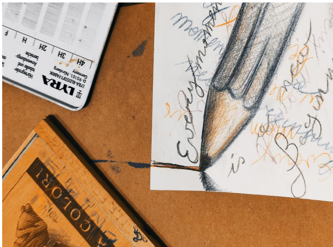
(M.F.Fontefrancesco, 2020, Matita/Matite)

A cura di Michele Filippo Fontefrancesco